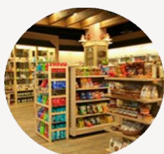
Lojas de Conveniência