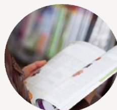
Livrarias e Quiosques