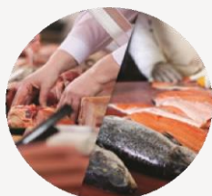
Talhos e Peixarias